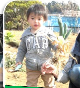
下仁田ネギ、とったど〜!