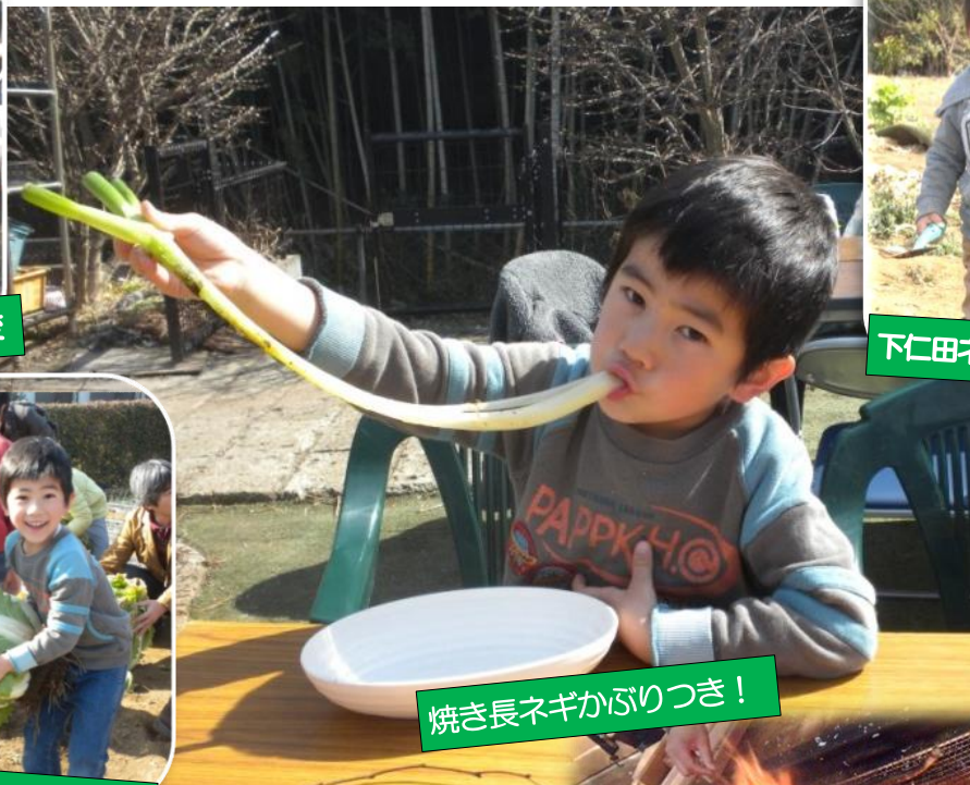
焼き長ネギかぶりつき!