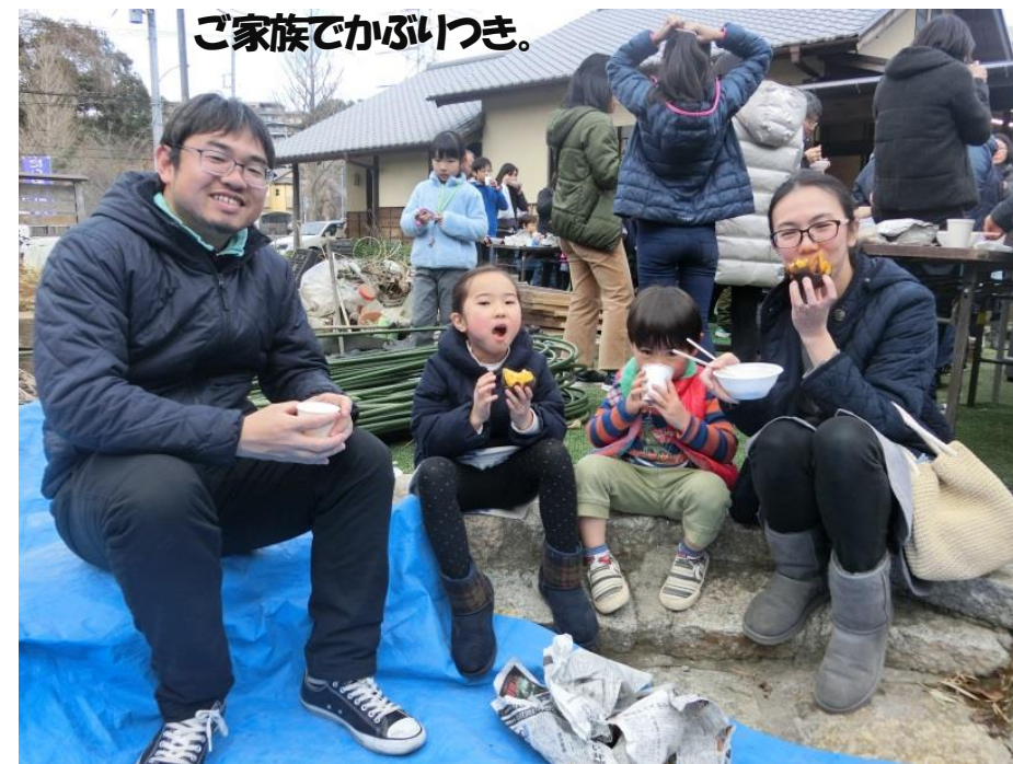
ご家族でかぶりつき。