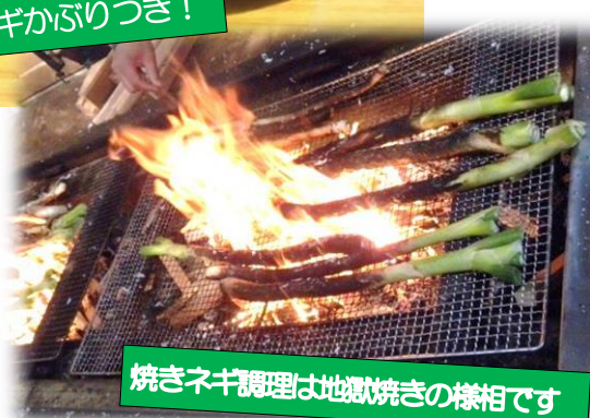
焼きネギ調理は地獄焼きの様相です