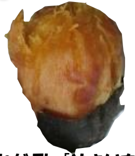
これがThe「やきいも」です