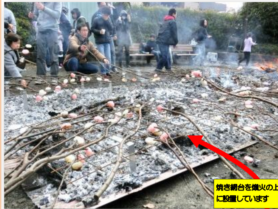
焼き網台を熾火の上に設置しています