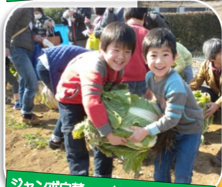
ジャンボ白菜、一人では運べません