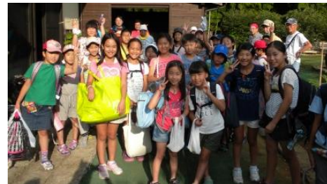
昨年参加の元気な皆さん

真夏の恒例行事「夏の小学生一泊体験」を今年も7月22日～23日に開催します。募集方法等の詳細は、例年どおり全戸配布チラシにてお知らせします。元気な子供たちの参加をお待ちしています！