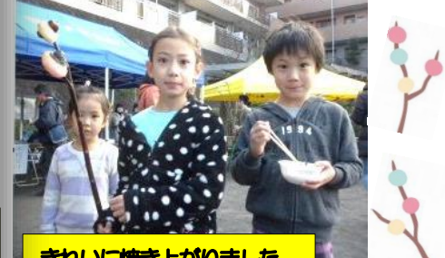
きれいに焼き上がりました。