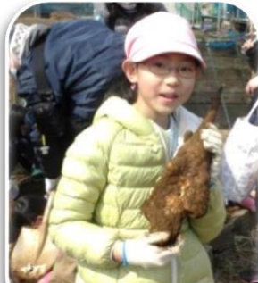
ナガイモは掘るのが大変

収穫体験の後は自然塾いりりで食事会です。焼きネギ(泥付長ネギ)と下仁田ネギの鍋、おでんにサトイモのみそ汁に麦飯トロロを堪能し、最後のデザートは焼き芋。特に焼きネギの甘さと麦飯トロロは評判が良かったです。昨年度から始めたいろいろサロン、如何でしたか？