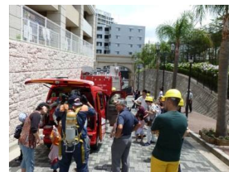
レイディアント訓練の様子

レイディアントでは春・秋年二回の防災訓練を実施しています。春は消防・避難訓練、秋は救命・防災準備を中心に、特に高齢者のいる要支援家庭への訪問、安否確認や、より同じ階層間での近隣声掛けを増やすように考えています。また栄区消防署の協力で、消火訓練・煙体験・蘇生訓練・消防車への乗車・消防士装備試着(子供に人気です)を行っています。(中川 繁)