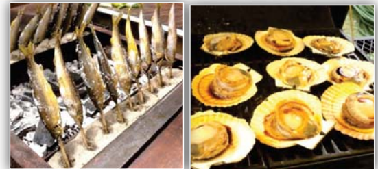
鮎の炉端焼き、1時間かけて焼き上げました!