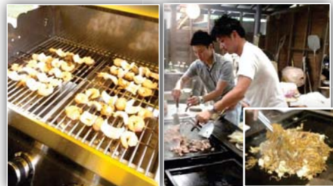
新企画の海鮮焼き