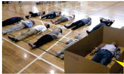
1m×2mの狭さを 実感している皆さん

避難場所での1人当たりの専有面積は1m x 2mと決まっております。本郷台小学校体育館での受け入れ人数はたった108人です。参加者の皆さんもあまりの少なさと狭さ(と床の固さ)に避難時の状況を実感しておりました。