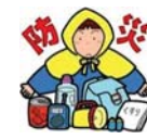
防災倉庫には、食糧や水のほか、ライトや組立てトイレ、工具類が備蓄されています

防災倉庫も見学しましたが、特に食料品の備蓄は少ないです。各家庭における普段からの防災意識と食糧・飲料の備蓄が重要です。11月20日には西谷戸町内会の防災炊き出し訓練を実施しますので、是非ご参加ください。(防災部)