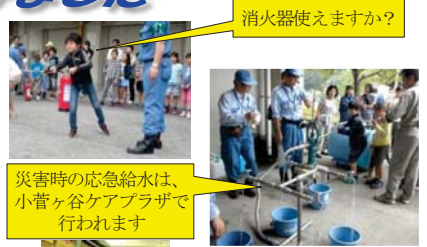
消火器使えますか?