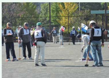
グラウンドゴルフ大会