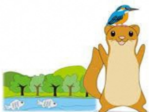
栄区いたち川マスコット タッチーくん

計画の推進には、まず各個人ができることをなし、それが町内会・自治会の活動につながり、各種団体やボランティア団体の活動へと波及し、歯車がスムーズに回転することとなります。皆様の総合力で小菅ヶ谷地区の計画を推進しましょう。