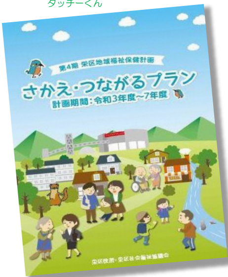
第4期栄区地域福祉保健計画 栄区版「さかえ・つながるプラン」

栄区の「さかえ・つながるプラン」と小菅ヶ谷地区の「小菅ヶ谷つながるプラン」は連動しています！